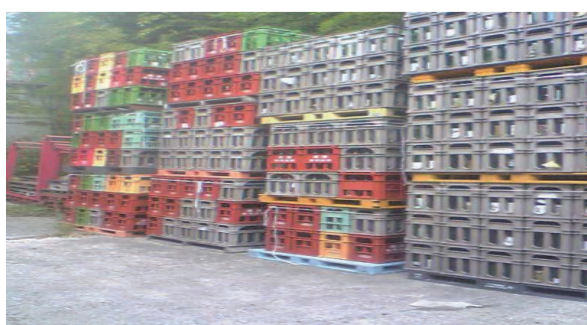
新びん流通以外で使用