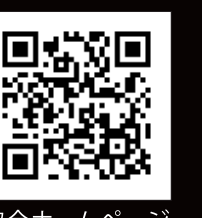
協会ホームページ

■正会員企業 (50音順) 石塚硝子株式会社 磯矢硝子工業株式会社 第一硝子株式会社 東洋ガラス株式会社 日本耐酸塩工業株式会社 日本山村硝子株式会社 ■準会員企業 (50音順) 株式会社大久保製場所 興亜硝子株式会社 大商硝子株式会社 日本精工硝子株式会社 株式会社野崎硝子製作所 柏洋硝子株式会社 株式会社山村製場所 ■賛助会員企業 (50音順) 井原硝子工業株式会社 AGCセラミックス株式会社 エム・ハート・グラス・ジャパン株式会社 大阪ガス株式会社 有限会社大原硝子リサイクル 株式会社カンヨー 株式会社グリーンバックジ 佐藤硝子株式会社 三和ガラス株式会社 三和フロンティア工業株式会社 JWガラスリサイクル株式会社 清水工業株式会社 硝和ガラス株式会社 株式会社タカハシ 株式会社テクノ月星 東海工業株式会社 東京ガス株式会社 株式会社トクチュウ 東洋ガラス機械株式会社 東洋カレット株式会社 東横硝子株式会社 株式会社トクヤマ 豊島硝子株式会社 中村ガラス株式会社 日晴硝子株式会社 日晴硝子株式会社 株式会社ニッシンエンジニアリング 日本機械金型株式会社 早川硝子株式会社 有限会社フォスベル・アジア・リミテッド 藤井硝子株式会社 株式会社フジシール 扶桑硝子株式会社 丸硝子株式会社 丸仙硝子株式会社 株式会社丸山工業所 三菱商事建材株式会社 矢崎工業株式会社 株式会社山一商会 株式会社吉田製作所