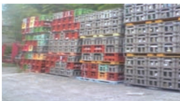
新びん流通以外で使用