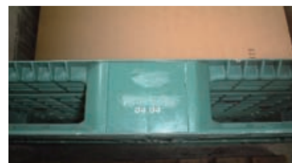
社名を消して使用