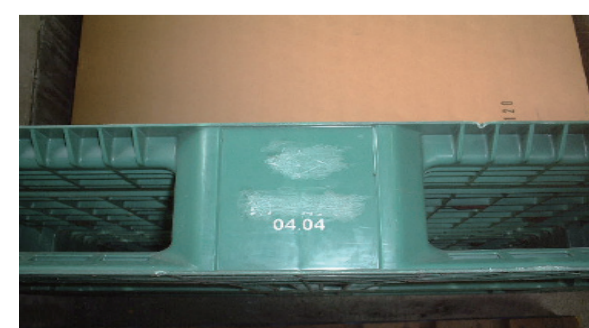
社名を消して使用