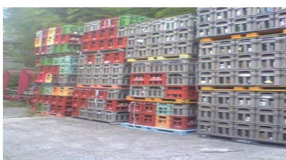
新びん流通以外で使用